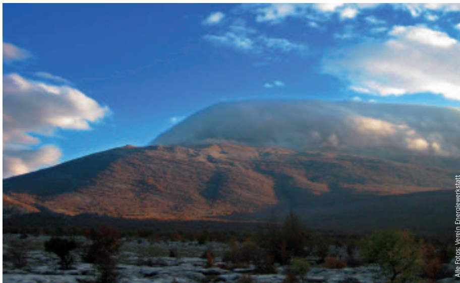
Druck- und Temperaturunterschiede zwischen den einzelnen Regionen verursachen lokal begrenzte, teils extreme Windbedingungen wie diese kalte Fallwindströmung am Velez Mountain.