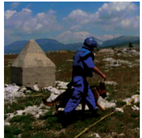
Leidvolle Geschichte: Vor Beginn der Arbeiten muss das Projektgebiet wie hier am Podvelez erst einmal entminet werden.

Unklare Zuständigkeiten seitens der Behörden, aber auch die politisch teilweise noch labile Situation erschweren die Errichtung der geplanten Windkraftanlagen. Vor allem in Serbien und Bosnien-Herzegowina müssen erst Genehmigungsverfahren entwickelt werden, die der Windenergie gerecht werden. Daher beanspruchen neben den Forschungsaktivitäten auch die politischen Verhandlungen auf lokalen, regionalen und staatlichen Ebenen sehr viel Zeit.